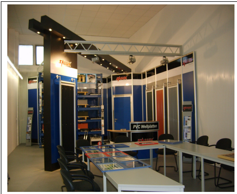
Bild 1: Der 2009 im Entwicklungs- und Forschungszentrum eingerichtete Show-Room wird heute auch von der Anwendungstechnischen Abteilung genutzt um beispielsweise Kunden neue Produkte und neue Erkenntnisse aus Forschung und Entwicklung zu präsentieren. Zusätzlich kann der multifunktionale Raum mit einfachen Mitteln „umgebaut“ und als Schulungs- und Seminarraum genutzt werden.