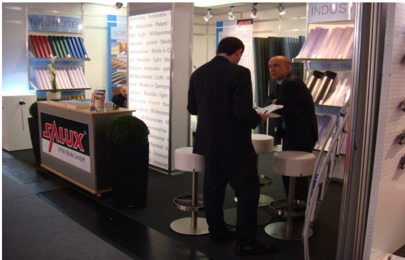
Bild 5: Auf unserem Messestand der Bau 2013 in München präsentiert die VPW Nink GmbH aus Sangerhausen alle Neuheiten. Bei praktischen Vorführungen wird die Vertriebs- & Marketingabteilung durch die AWETA „handfest“ unterstützt. Neben dem umfangreichen Salux® Portfolio wurde zusätzlich die Abstandshalter-Neuheit DrehQuick® vorgestellt und stündlich an Objekten vorgeführt. Foto im Vordergrund links: der Vertriebsleiter für D und W-E, Herr V. Dutz und der Vertriebsleiter O-E, Herr L. Zwirello (rechts) im Gespräch

unserem Kunden zeitnahe umgesetzt werden ( Projekt: Trinkwasseraufbereitung, Ort: Marokko, Produkteinsatz: Salux® W-WT ).